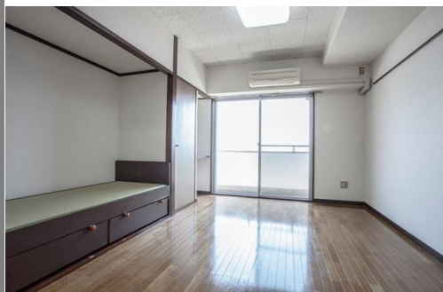
サッシ H:1890 W:1830