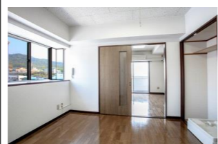
出窓枠 H:935 W:1900