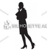
ビジネスマンの拠点に