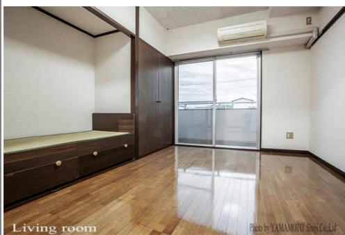
サッシ H:1890 W:1830