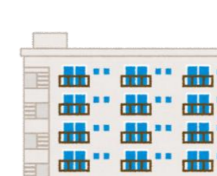
会社借り上げ社宅に