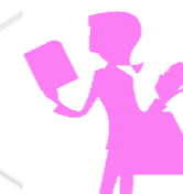
学生さんの部屋に