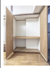
H:1880 W:1350 D:800