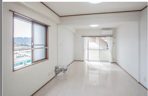
サッシ H:1870 W:1800