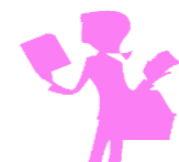
学生さんの部屋として