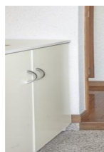
下駄箱 H:800 W:700 D:400