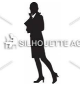
ビジネスマンの拠点に