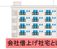
会社借上げ社宅として