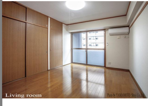
Living room IMG_5-401-2-s